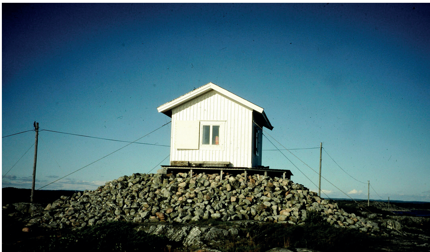
Lotsutkiken på Mönster.