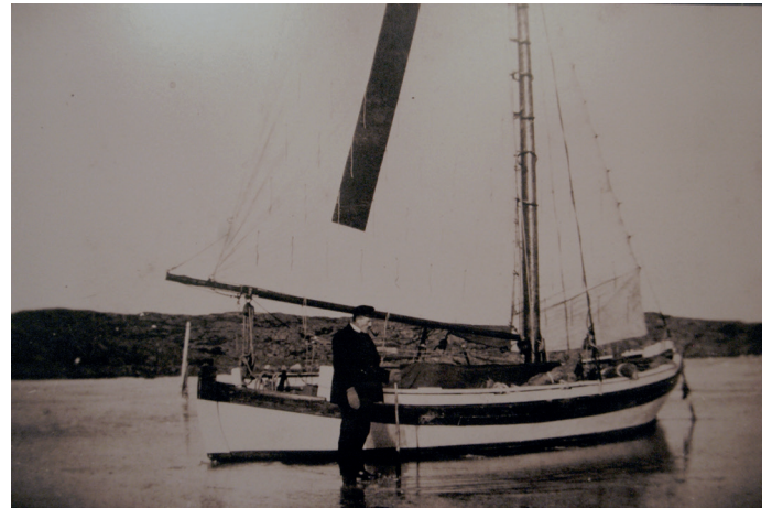
Lotsbåt som ligger fast i isen