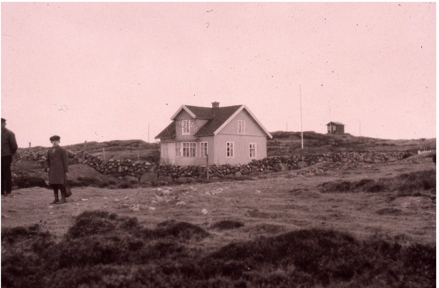
Mönster i gamla tider.