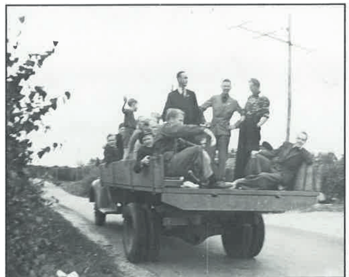
1942 tog man lastbilen till matcherna.